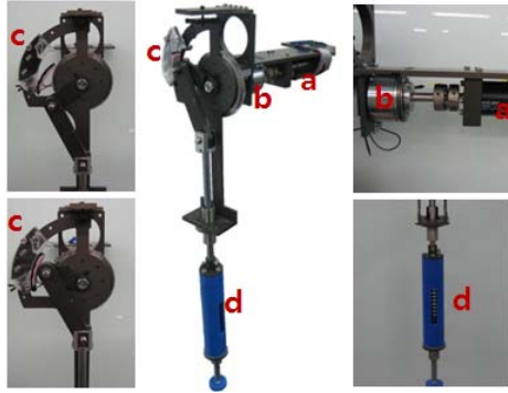
Fig. 2 Prototype: (a) Motor, (b) Clutch, (c) Holding mechanism, (d) Linear spring.

모터와 크랭크 사이에 클러치(b)를 추가로 장착하고 클러치의 작동을 고정장치(c)를 통해 제어하였다. 고정 장치의 메커니즘은 다리가 공중에 있는 동안에 크랭크 암을 고정 장치에 고정하고 클러치를 통해 동력을 차단하여 일정한 각도, 즉 항상 같은 각도로 지면에 착지하는 메커니즘이다. 시제품의 자세한 사항은 아래의 표와 같다.