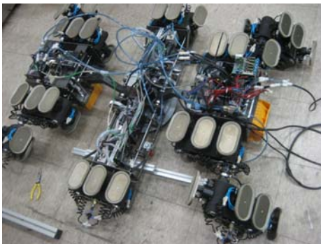
Fig. 3 Multi-body climbing robot with tracked wheel mechanism

Fig. 3 은 총 10 개의 무한궤도휠이 장착되어 최종 개발된 다관절 등반로봇을 보여준다. 본 로봇은 총 3 개의 바디로 구성되어 2 번째 바디 배면에는 제자리 조향용 흡착패드 모듈이 설치되어 있다. 이는 수직벽 등반 뿐만 아니라 벽면간 이동이 가능하도록 개발된 로봇이다.